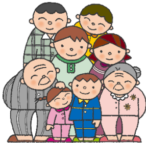
令和4年度 西神楽公民館市民講座 講座内容 (第6回以降分)